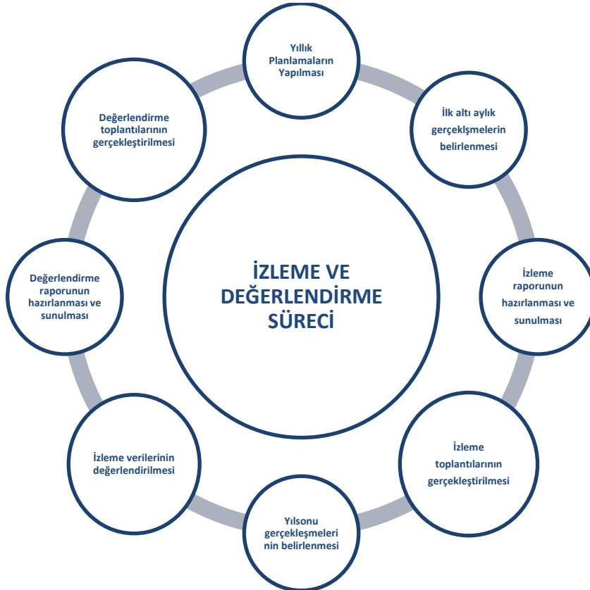
Stratejik Plan İzleme ve Değerlendirme Modeli